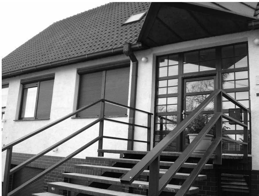
Smolenická fara.

Bol nositeľom a hýbateľom takeého množstva aktivít, že nikto z farníkov nemohol povedať, že sa nemá do čoho zapojiť. Samozrejme, že do revolúcie to bolo skromnejšie a opatrnejšie, ale zato často i dobrodružnejšie. Za všetko spomeniem aspoň stretnutia na starej fare alebo pravidelný dobrodružný polnočný silvestrovský výstup na Záruby v atmosfére vďačnosti Stvoriteľovi. No a keď sme starým časom odzvonili, tak už to boli pravidelné stretnutia pre deti, výlety do prírody, nespočetné aktivity pre miništrantov, ktorých boli desiatky a pri oltári sa často neušli všetkým ani miništrantské košeľe, pingpongové, šachové, futbalové turnaje, piatkové stretnutia mládežníkov so Sv. písmom a gitarou, zapájanie spevokolov, kto-