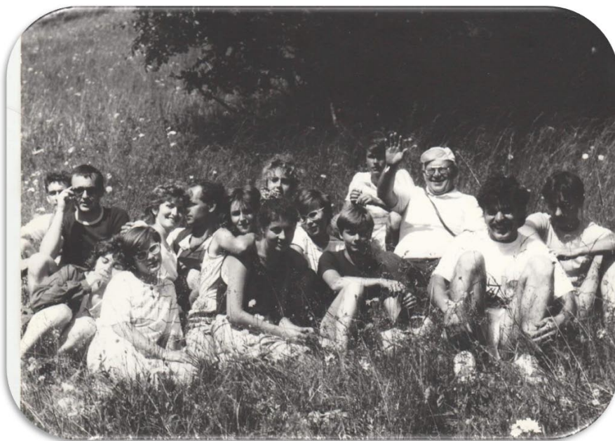
Na výlete v Nízkych Tatrách s mládežou, 1991.

Nežná revolúcia v r. 1989 priniesla hlboký výdych duchovenstvu. Už sme sa nemuseli potajomky tlačiť v maličkých sakristii a novým domovom piatkových stretiek sa stala stará fara, dnešné Múzeum Molpír. Velebníček otvoril dvere dokorán a mládež tam bola v piatok večer skutočne ako doma. Miestnosť medzi vtedajšou kuchynou a spálňou bola využitá na pingpongové turnaje. Dookola stola sa po pingpongu rýchlo nanosili