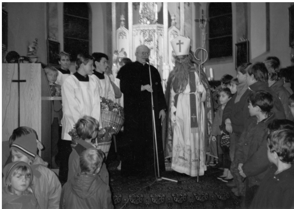
Keď chodil sv. Mikuláš.