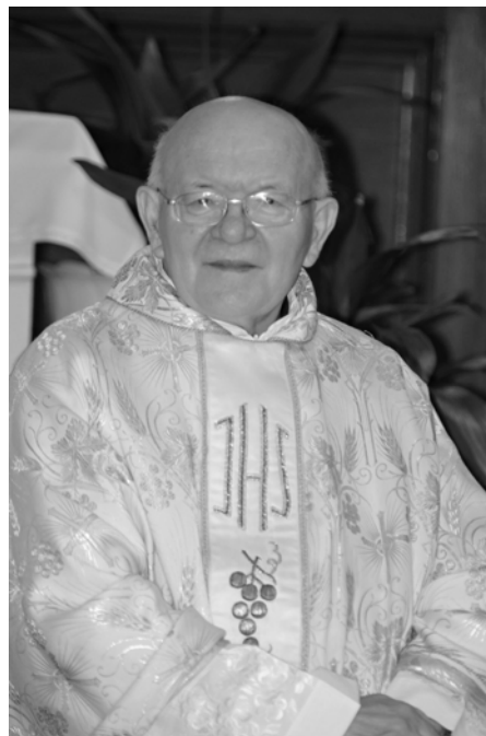
Smolenické farské dni 2013.

Nezabudnem, ako ma raz otočil z kostola, že sa mám ísť prezliecť. Dnes sa na tom smejem. Bola som asi štvrtáčka, išli sme so sestrou do kostola na skúšku zboru a mala som oblečené ružové krátke šortky. No krátke, boli niečo nad kolená. Ale do kostola sukňa po kolená alebo dlhé nohavice! Mohla som mu vysvetľovať, že idem len na skúšku a ešte k tomu na chórus! Aj keď bol niekedy prísny, oveľa častejšie nás zahrňal láskou, ktorá roztápala srdce. Brával nás na túry, aj na polnočné silvestrovské, a často opakoval, že treba veľa športovať, aby z nás neboli „lekvárkovia“. Nezabudnuteľné boli aj púte s ním – Rím, Mariazell či mnohé slovenské miesta a všade sa spievalo z plného hrdla. Pamätám si, že to bolo pre nás nepochopiteľné, keď zaznelo rozhodnutie, že má byť preložený inam. Brali sme ho ako súčasť nášho života, súčasť duchovnej rodiny, ktorá mala pevné putá. A tak to zostalo až do konca. Veľmi sa mi páčila jeho pevná vôľa nikdy sa nevzdávať, aj keď to mal v posledných rokoch veľmi ťažké po zdravotnej stránke, vždy sršal humorom, optimizmus ho neopúšťal a roz-