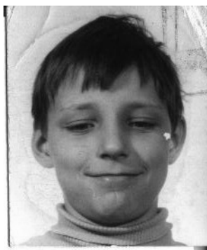
Kedysi a dnes. Podobajú sa?

Čo sa týka Oázy, tak by sa dalo povedať, že tu má svoje zázemie. Oáza začala ešte za totalitu v Poľsku a vychádza z tajomstiev ruženca. Oázové tábory, či lepšie povedané duchovné cvičenia, trvajú 15 plus 2 dni (deň príchodu a deň odchodu) a majú svoj vlastný program usporiadaný pre jednotlivé kategórie. Už niekoľko rokov tu organizujú Oázy základného stupňa (Oáza 0) a posledné leto to boli 2 turnusy. Na tento rok je naplánované v rámci možností aj Oázové leto pre 13 – 15 ročných (5+2 dni), 2 turnusy Oáza 0 (15 – 18 roční) a jeden Oáza 1 (18+). Nie je to niečo