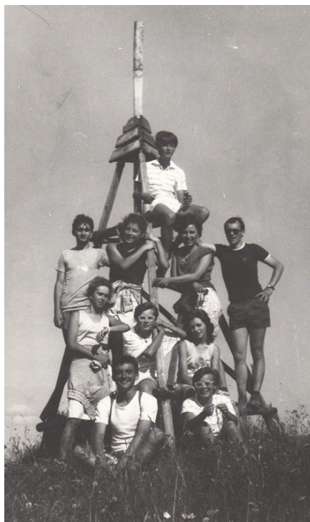
Nízke Tatry, 1991

Snáď najviac na mňa zapôsobili výlety s Velebníčkom doma aj v zahaničí, keď sme sa my mládež stali podľa jeho slov, „Pelegríni a Vagabundi“. Nezabudnem na jeden krátko po Nežnej revolúcii, keď sme sa nadchnutí slobodou v lete vybrali do našich nádherných Nízkyh Tatier. Velebníček zorganizoval pätnásť mládežníkov, trinásť zo Smoleníc, dvoch cezpoľných z Dolných Orešian a Trnavy. Strávili sme spolu sedem dní v tradičnej chalúpke v Liptovskej Osade. Chalani a on boli v prednej izbe, kde sme aj mávali sväté omše. Dievčatá spávali na druhom konci drevenice, v strede bola kuchyňa, latrina a studňa vonku. Kto ste Velebníčka poznali, viete, ako miloval