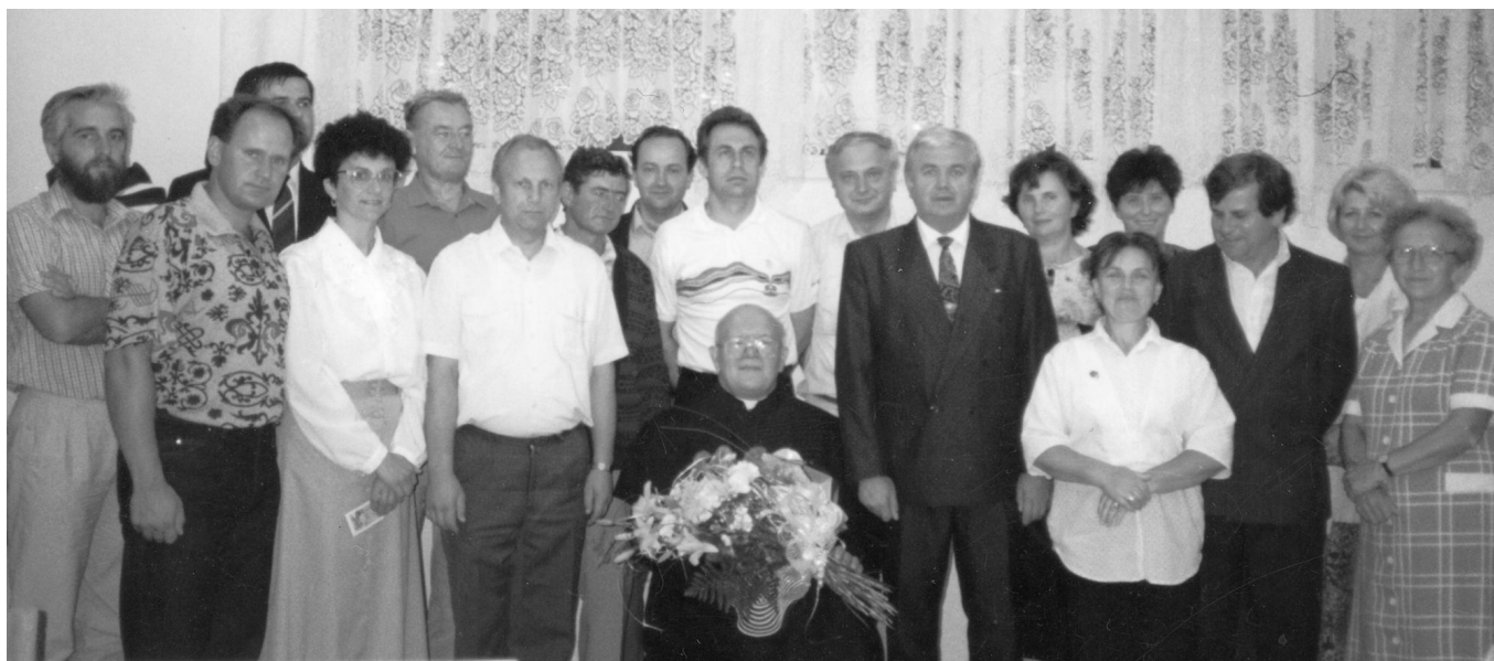
Rozlúčka so Smolenicami.