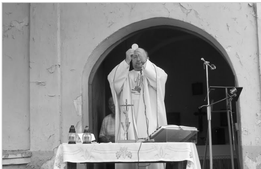
Svätá omša pri Kaplnke svätého Rócha v Smoleniciach v roku 2012.

Dalo by sa pokračovať výpočtom toho, čo sa podarilo či nepodarilo, ale to asi nie je podstatné. Podstatné je, či