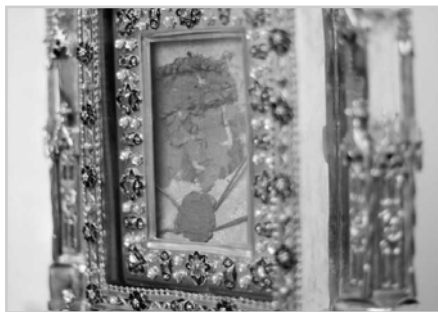
Relikvia Kristovej krvi.