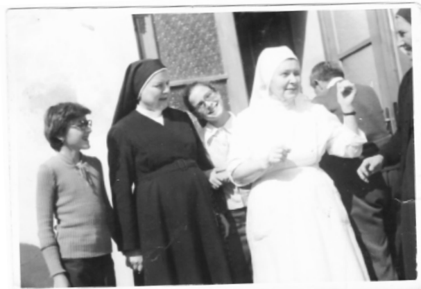
Sestry boli otvorené pre návštevy.

Mnohí zvykli chodiť na sväté omše do kláštora a kňazi, ktorí pôsobili v charitnom dome, významne pomohli aj pri pastorácii vo farnosti.