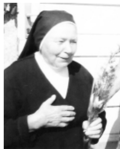
Sestra Eustela.