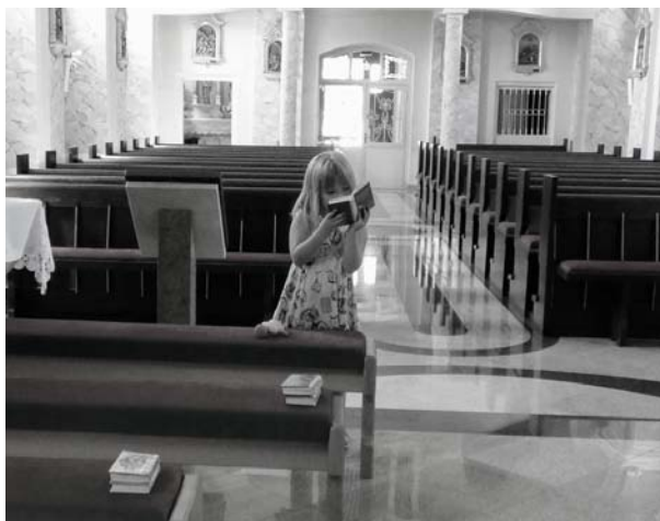
Deti sa potrebujú oboznamovať s liturgickým priestorom.

Do kostola chodí všeobecne málo detí. Tie, ktoré prídu, prichádzajú s rodičmi. Účasť na svätých omšiach sa u detí zvýši pred prvým svätým prijímaním a znova po ňom upadne, lebo prestane byť čímisi povinným, čo podmieňuje prijatie sviatosti Eucharistie. Sledujeme reálne túto situáciu, ale