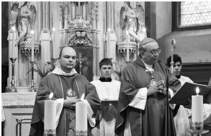
Obrad uvedenia dekana do úradu.

A všade byť k ľuďom milý, empatický, chápať ich situáciu a prispôbiť sa ich reči... Ľahko je povedať, si na Slovensku, hovor po slovensky, no ale choďte do Vojvodiny, do Rumunska a povedzte našim Slovákom, nauč sa po rumunsky! Prečo chceš slovenskú sv. omšu? Každý svoje intímne duchovné vzťahy, modlitbu, si vybaví najlepšie vo svojej materinskej reči. To nevygumujete. Ako je dieťa 9 mesiacov v lone matky, už vtedy vníma materinskú reč. To netreba nikomu brať. Ale radšej sa naučiť jazyky a používať to ako evanjelizačný nástroj. Mnohým som to už vysvetľoval, niekto to príjmu, iní nie. Mám výbodu, že som od Bratislavy zo zmiešanej rodiny. Bolo to vždy normálne, že starý otec rozprával po nemecky, babička po maďarsky, mamičku som mal Záboráčku z Lozorna. Takže tam to tak prirodzene fungovalo.