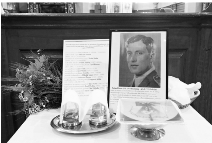
Dňa 6. apríla 2019 bola odslúžená sv. omša pri príležitosti 80. výročia tragickej smrti pilota Štefana Devana.