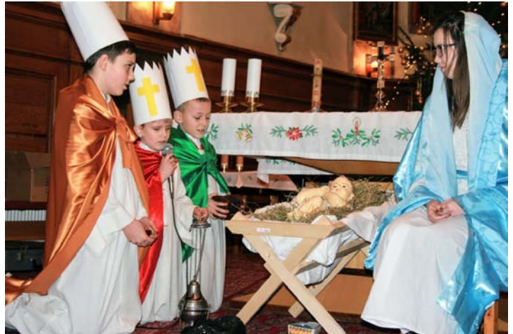
Jasličková pobožnosť má dlhoročnú tradíciu.

Z toho vyplýva, že prekážka pokoja je v tom, že nechcem