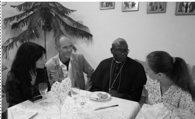
Otec Ludvick v rozhovore s redaktormi.

Kahama je mladá diecéza, ja som jej druhý biskup. Mám dvadsať