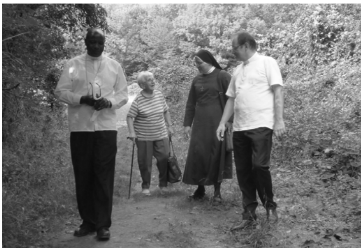
Program bol bobatý, ale našiel sa v ňom čas aj na vychádzku do prírody.

sedem farností, ja sám mám na starosti dve z nich, kňazov mám v diecéze málo - štyridsať, z toho desať je misionárov napr. z Talianska či Argentíny. A plány? Školy, kliniky, kostoly, farnosti, konventy...môžeme povedať, že niektoré plány sú dlhodobé iné krátkodobé, práce je veľa.