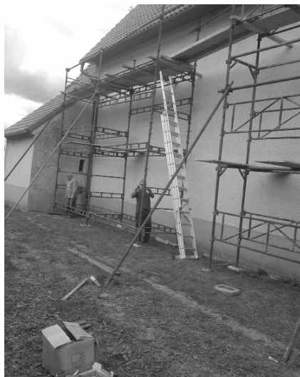
Práce na lešení v Neštichu.

V havarijnom stave je samotná drevená konštrukcia schodiska na vežu ku zvonom. Je silno narušená červotočom, na mnohých miestach sú nefunkčné zábradlia, podlahy jednotlivých medzistupňov sú vypadané a pri výstupe do veže údržbou a servisom ku hodinám alebo zvonom hrozí vážne riziko úrazu. V rámci rekonštrukcie je nutná výmena a osadenie muriva nosných drevených trémov do nových veže, schodísk na jednotlivé podlažia,