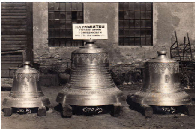
Zvony boli posvätené 7. septembra 1930.

Ďakujeme všetkým ochotným ľuďom za odbornú a brigádnicú pomoc a vyprosujeme hojnosť zdravia, šťastia a Božieho požehnanie.