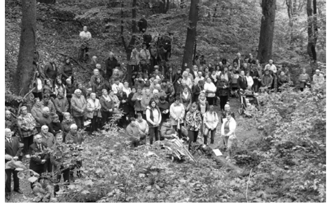
Púť do Hlboče, 1.5.2016

Takto Kráľovná mája sa skveje znova v plnej kráse na svojom mieste, kde prichádza veľa miestnych i cezpoľných, aby si uctili Matku Božiu a prosili ju o pomoc a ochranu. Sošku Panny Márie 8.2. 1985