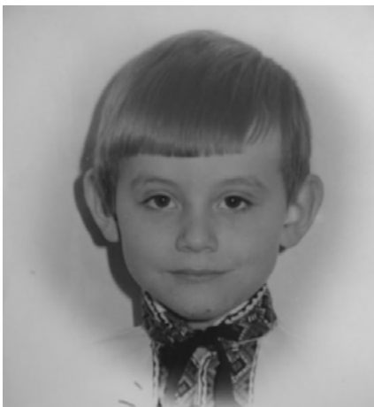
6-ročný, na Vianoce 1975

Zlom nadišiel pri jednej sv. spovedi, kedy pán farár sa ma opýtal, či nechcem byť kňazom. Samozrejme, povedal som nie, veď som aj chodil s dievčaťom, ale moja odpoveď „nie“ bola zo strachu, lebo sa ma opýtal na niečo, s čím som bojoval dlhé mesiace, teda, že som Bohu stále dokazoval, že pre mňa cesta byť kňazom je hlúposť, lebo mám problémy v