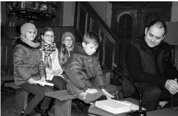
Počas šk. roka sa deti, predovšetkým tie prvoprijímajúce, modlili pred sv. omšou v nedeľu ruženec.

Aj keby sa možno zdalo, že už je „po všetkom“, opak je pravdou - týmto dňom sa nič nekončí, ale naopak, začína sa život s Pánom Ježišom, ktorého deti prijali v Eucharistii, aby precítili jeho lásku a aby tejto láske zostali verné po celý ich život. Svätá Terezka z Lisieux spomína na deň prvého svätého prijímania takto: „Najkrajší zo všetkých dní napokon prišiel!...Bol to božek lásky. Cítila som sa milovaná a hovorila som: Milujem ťa, dávam sa ti navždy.“