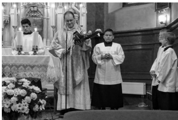
Sv. omša pri príležitosti 25. výročia kňazskej vysviacky

- učia ma dôverovať Bohu, vydať sa do jeho rúk. V ňom nachádzam pokoj a nádej a liečenie všetkých smútkov.