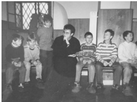
Kaplánke začiatky, stretnutie s miništrantami

A tak som sa dostal sem, do Smoleníc, do mestečka oplývajúceho krásou prírody a boľavých vzťahov. Našiel som tu ľudí veľmi štedrých, pracovitých, horlivých, ale aj sklamaných, znechutených či sľubujúcich to, o čom vedia, že to nedodržia, ako sa ukáže po birmovke či Prvom sv. prijímaní. Spoznal som, že nemám v moci zmeniť ľudské srdcia, aj keby som sa rozkrájal. Preto Smolenice mi dávajú veľa