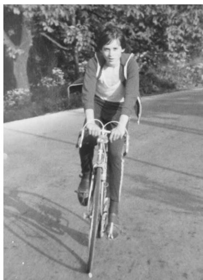
Cyklistika bola viac než záľuba a trvá dodnes

komunikácii a bojím sa vystupovať na verejnosti, čítať a pod. Nastal vo mne veľký boj. Úľava prišla až vtedy, keď som pred Bohom kapituloval. Nemal som však odvahu povedať to farárovi, ale niekomu som to musel povedať – kamarátovi, ktorý sa už hlásil na teológiu. Nechcel som, aby to povedal farárovi, ale aj tak mu to povedal a potom sa už veci rozbehli, síce nie tak ako som chcel, ale tak, aby sa splnila Božia vôľa. Tak som sa už poručil do Božej vôle.