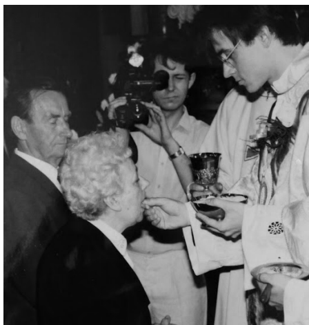
Primície v Novom Meste nad Váhom, rodičia

otcov brat boli perfektní harmonikári. Moc sa mi spočiatku nechcelo, ale umenie má svoje čaro, otvára dušu, cit, a je aj ako ventil. Vtáci to vedia od narodenia, my to musíme v sebe objaviť. V súčasnosti hrávam tak sporadicky, momentálne môj akordeón majú požičaný Fidlicanti, ale poznám dobre noty, takže nie je problém sa do toho dostať.