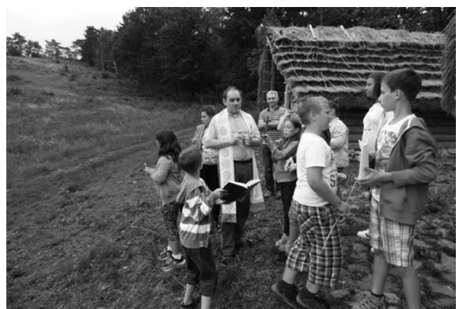
Že aj príroda je miestom pre modlitbu, sme sa presvedčili po jednej detskej sv. omši na Molpári.