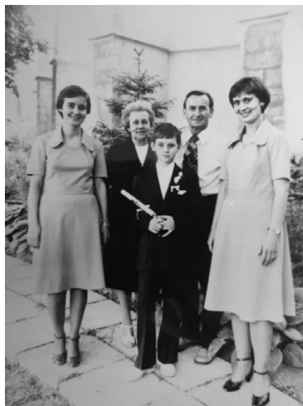
1. sr. prijímanie, s rodičmi a so sestrami