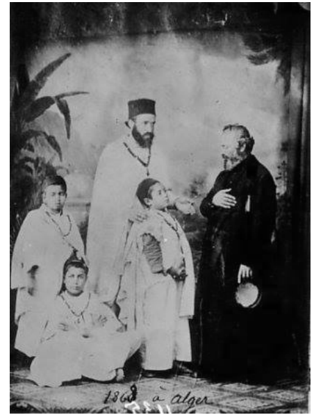
Sv. Daniel Comboni.

Jeden z veľkých misionárov Afriky Daniel Comboni (1831–1881), pôsobiaci v sudánskom Chartúme, ktorého pápež Ján Pavol II. vyhlásil v roku 2003 za svätého, odporúčal misionárom, že „by mali mať dôverný vzťah s ľuďmi ako konkrétnymi osobami, mali by pochopiť ich spôsob myslenia a zvyky a minimalizovať nepodstatné vonkajšie rozdiely by malo byť opakujúcim sa úsilím misionárskych zakladateľov.“ Ovládať jazyk, pochopiť tých druhých a pre Krista zabudnúť na seba – veru neľahká úloha, ktorá si vyžaduje formáciu misijných rádov či spoločností s dlhoročnými skúsenosťami. Povedzme si otvorene, nikto vás tam nečaká s otvoreným náručím a netuží, aby ste ich prerobili na svoj obraz. Ešte hlbšie túto úlohu špecifikoval kardinál Lavigerie (1825 – 1892), zakladateľ vychýrených „bielych otcov“ (prezývaných podľa bieleho habitu, nie podľa odtieňa pleti), slovami: „Musí tu byť jasne povedané: miestni sa majú stať kresťanmi, nie Francúzmi alebo Európanmi.“ Majúc tieto slová na mysli, rozmysľam nad pastiermi, ktorých