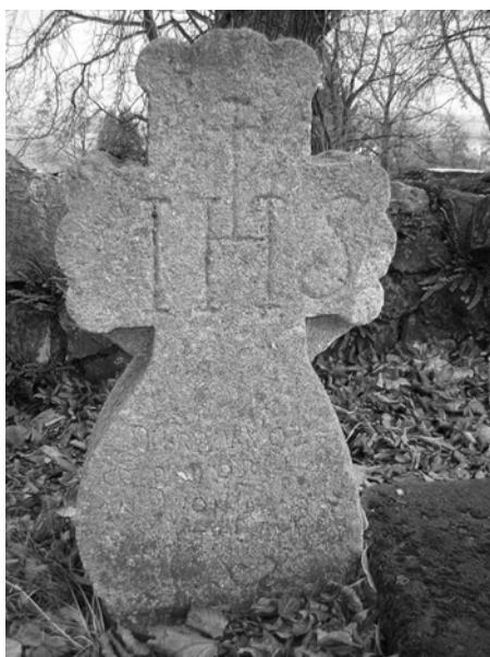
Jeden z náhrobkov pri starom múre Smolenického kostola.

Na náhrobkoch sú dnes značné vplyvy poveternostných podmienok a postupne ich obrástol lišajník a mach. Aj pieskovec, z ktorého boli vytesané, je výrazne zvet-