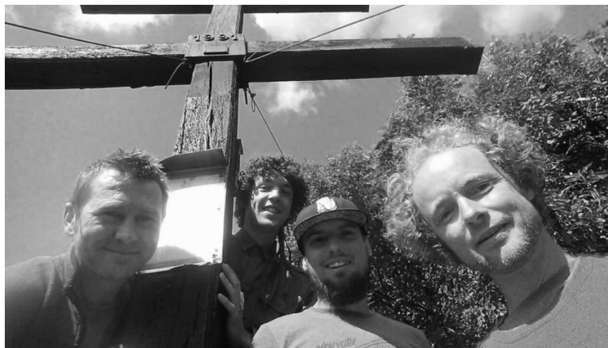
Na Zárubách.

V závere sa už netajili tým, že vedia úplne presne o všetkých svaloch na tele, a že ich bolí každý pohyb. Všetky práce od odstraňovania náterov, brúsenia, prípravy podkladu až po záverečné natieranie sú fyzicky náročné aj na zemi. Vo výške je treba mať na pamäti neustále bezpečnosť, istenie, stabilitu pohybu a popritom „robiť“. Niektorí sme po prejavení záujmu mali možnosť vyskúšať si výstup na vežu a zlaňovanie po rovnej stene. Pre úplného laika v tejto oblasti to bol dost adrenalínový zážitok. Zároveň stúpol