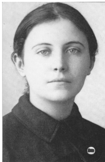
Sv. Gemma Galgani

lásku k úbohým duším trpiacim v očistci. Raz sa dozvedela o istej sestričke z rádu pasionistov, ktorá bola blízko smrti. Gemma poprosila Ježiša, aby umožnil tej sestre odpykať si všetko už tu na zemi, aby tak mohla po smrti odísť rovno do neba. Sestra o pár mesiacov zomrela. Gemma túto sestru pomenovala Mária Terézia od Diet'á't'a Ježiša. Tá sa jej potom zjavila plná zármutku a poprosila o pomoc, pretože znášala veľké bolesti v očistci za určité poklesky. Od tej chvíle si Gemma nedopriala žiadnu prestávku, stále sa modlila, plakala a bojovala v „zápa-