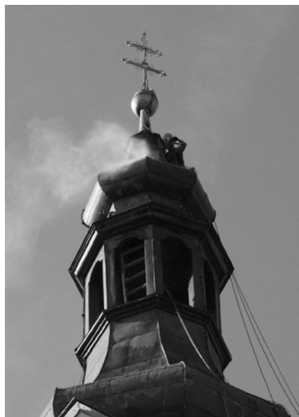
Veža počas rekonštrukcie.