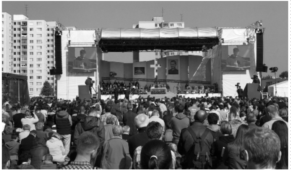
Blahorečenia sa zúčastnili aj farníci zo Smoleníc.