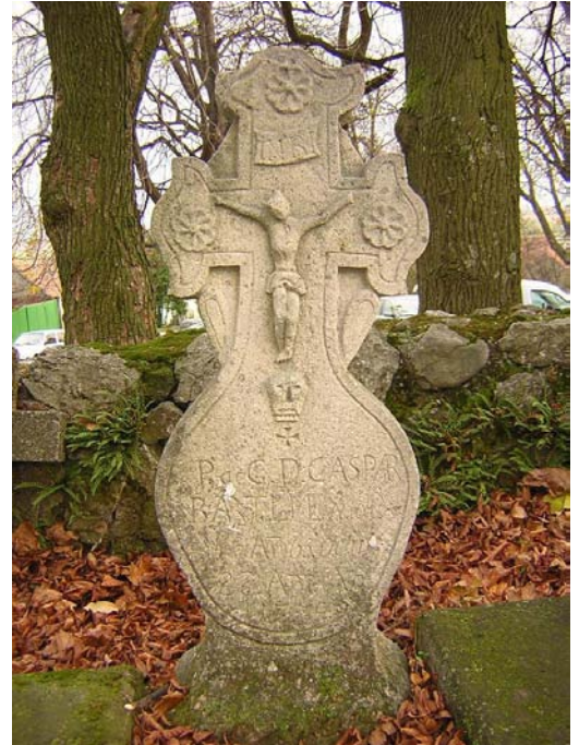
Jeden z nábrobkov pri starom múre Smolenického kostola.

Láska je silnejšia než smrť, preto aj naši blízki, ktorí sú pri Pánovi, sa tešia, keď to v živote nevzdáme, nájdeme motiváciu ísť ďalej a máme radosť zo života.