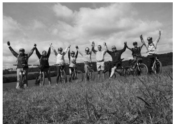
Cyklistika na Dobrú Vodu

Aby sme nevyšli z cviku, 31. júla sme sa odhodlali znova rozhýbať a obrátili sme sa tento raz opačným smerom, kde bol naším cieľom Plavecký hrad. Začali sme rannou sv. omšou a tentoraz s podstatne teplejším