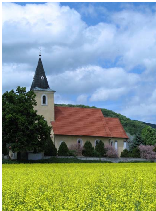
Kostol Nanebovzatia Panny Márie v Neštichu

Aj Boh je taký. Adam a Eva ťažko zhrešili a pokazili plán „A“.