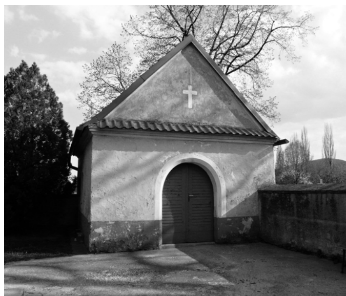
Kaplnka Navštívenia Panny Márie v Neštichu