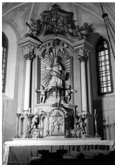
Hlavný oltár, Neštich, polovica 20. stor.