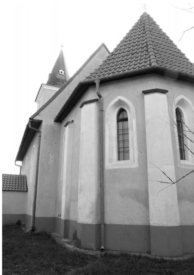
Menej známy pohľad na kostol

Nikdy som nechcela a ani nechcem, aby si naši veriaci mysleli, že sa predvádzam, a preto som prosila a vždy prosím nášho Pána, keď mám službu, aby sa On prihovárал Puďom mojimi ústami. Vždy si pripravujem srdce a myseľ na spoluprácu s Božou milosťou. A čo mi to dáva? Môžem povedať že veľa. Služba ma posúva bližšie k Bohu. Naučila som sa rozjímať nad Božím slovom, nezatvrdzovať si srdce a prijímať Božiu lásku, ktorú sa snažím rozdávať ďalej v každodennom živote.