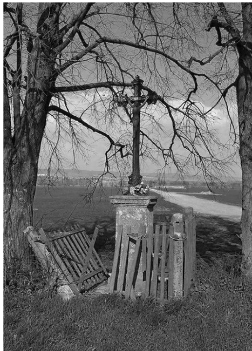
Báseň je inšpirovaná krížom, ktorý stojí za Neštichom.

milovať láskou takou istou. Neunikne jej nikto z nás, ani keď za hrst' zlatých listov z korún líp sfúkne majster čas.