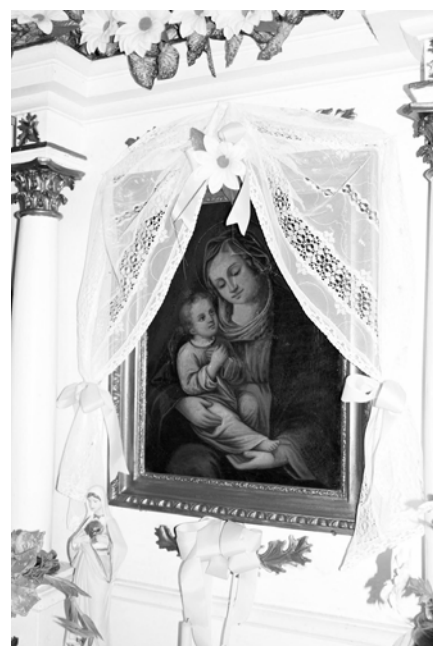
Obraz Panny Márie umiestnený v Kaplnke Panny Márie Karmelskej