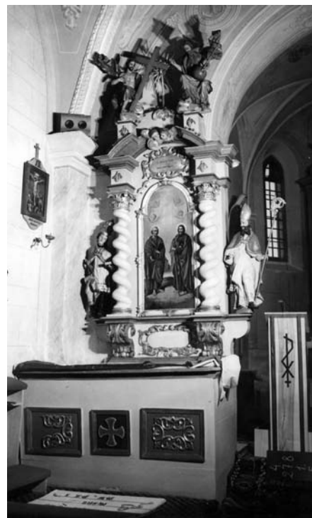
Sv. Peter a Pavol, bočný oltár, pol. 20. storočia

V kanonickej vizitácii z roku 1782 sa uvádza, že Neštišania žiadajú, aby boli oddelení od farnosti Boleráz a pripojení k farnosti Smolenice. Táto žiadosť bola zamietnutá. A tak sa stal Neštich filiálkou Smoleníc až v novodobej histórii.