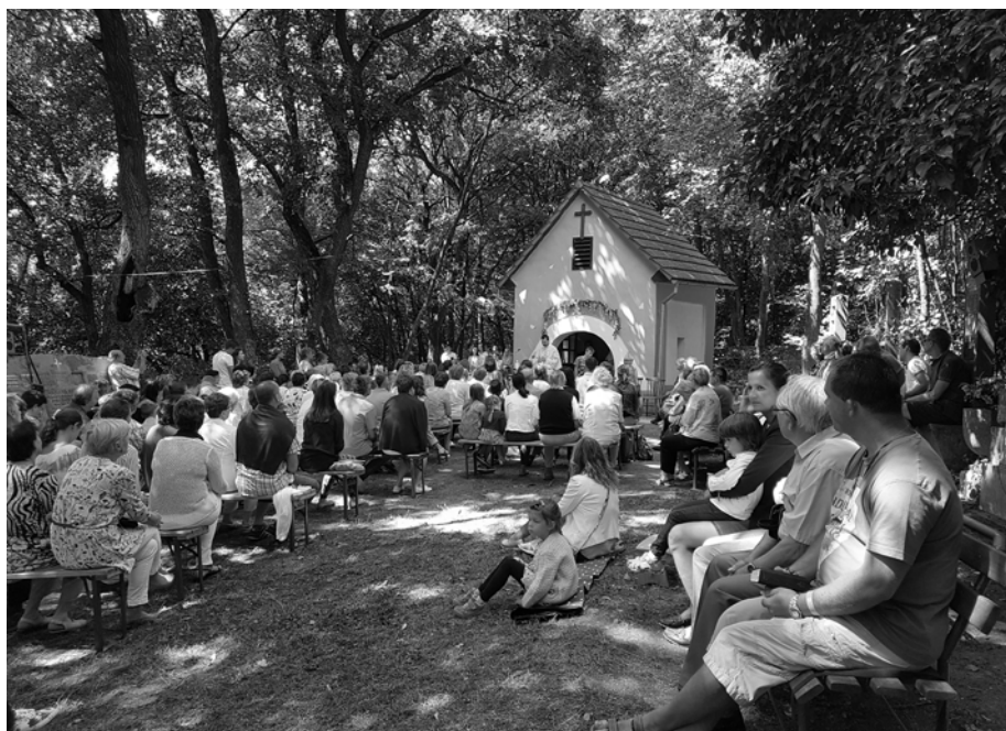
16. júla na sviatok Panny Márie Karmelskej sa konala pri kaplnke svätá omša. Tradične pomáha organizačne zabezpečiť toto duchovné podujatie aj Obec Smolenice.

Od 17. storočia až po dnes sa k Panne Márii Karmelskej utieka ľud volajúci o pomoc a ochranu, o čom svedčia aj tabuľky podakovania za vyslyšané modlitby.