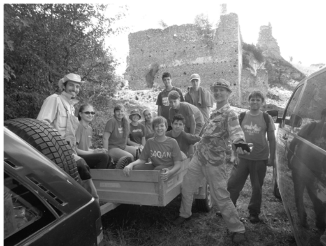
Dobrovoľníci priložili ruku k dobrému dielu.

Po namáhanom týždni bolo za nami na hrade vidieť (nielen) kus dobre vykonanej práce. A hoci ak hrad znovu zarastie, aj keď sa budú múry znovu rozpadávať, čo nám tento týždeň dal, v nás pretrvá. Vzt'ah k práci,