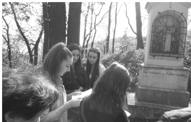
Krížová cesta s birmovancami.

farnosti. Je to možnosť zapojiť sa do liturgie čítaním alebo spevom, upratovaním kostola, účasťou na stretnku, napísaním príspevku do farských novín alebo na web a podobne.