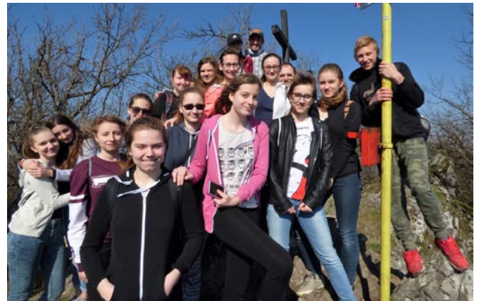
Birmovanci na Zárubách, 1.4.2017.

Čuším, či prítakávam (robia to „všetci“), alebo prejavím svoj postoj kresťana, ktorý nám Pán ukázal cez Zjavenie?