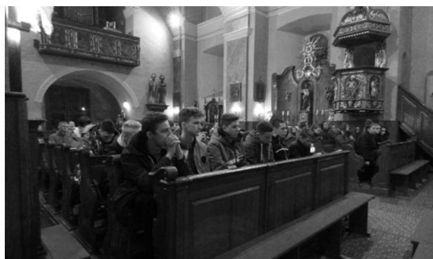
Birmovanci sa stretávajú raz mesačne spoločne na prednáške.

Niektorí mladí po sviatosti birmovania Boha opúšťajú, stoja pred kostolom, podľahnú alkoholu, cigaretám a do-