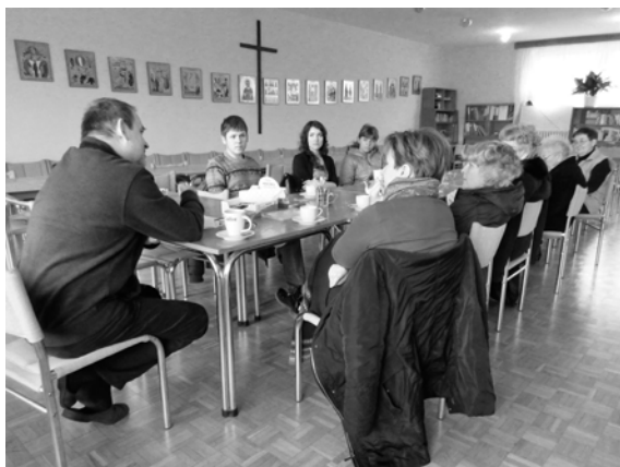
Farská katechéza 19.3.2017 na tému „Keď veríme iným bohom...“

kým čisté srdce nevyklíči z hrobu, drahšie jak zlato, vzácnejšie než soľ.