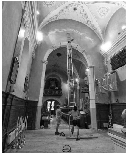
Hasiči počas záverečného upratovania.