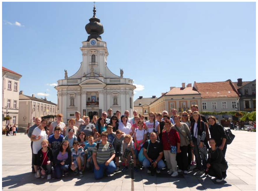
Farská púť v roku Božieho milosrdenstva.

A potom začne cesta. Boh postupuje presne ako otec z príkladu, ktorý učí dieťa chodiť: na okamih, na chvíľočku nás pustí. Príde zrazu kríza, nebezpečenstvo, bolesť, strata radosti... Dokážeme Bohu v tejto „skúške“ dôverovať? Ak áno, v nasledujúcom okamihu sa presvedčíme, že naša dôvera nás nesklamala! Zažijeme novú skúsenosť Bože moci a lásky. Opäť sa vráti radosť. Vyrieši sa problém, ktorý nás trápil. A naša viera sa skrze túto „skúšku“