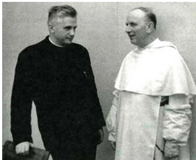
Na fotografii Joseph Ratzinger (vľavo) a Yves Congar (o ktorom hovorí Benedikt XVI. ako o veľkom misionárovi z Louvenskej univerzity) v čase Druhého vatikánskeho koncilu.

V roku 1963 mal na starosti dogmatiku a dejiny dogiem na univerzite v Münsteri. Od roku 1966 vykonával ten istý úrad na univerzite v Tübingene a v rokoch 1969 až 1977 na univerzite v Regensburgu. Tam sa v roku 1976 stal viceprezidentom.