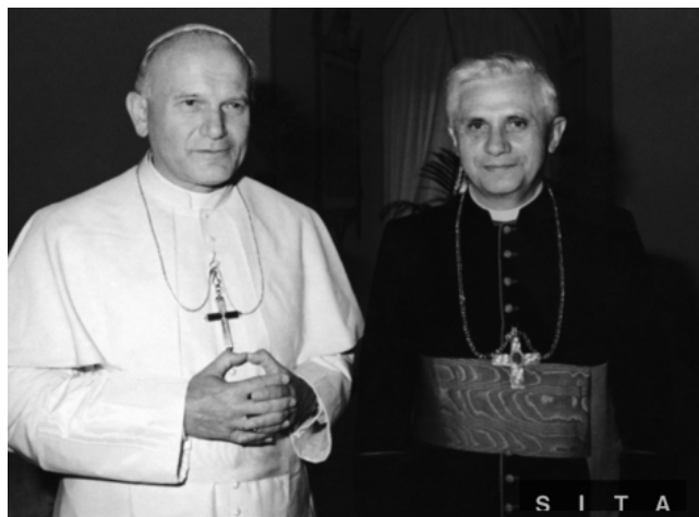
Jozeph Ratzinger (vpravo) a Ján Pavol II. v roku 1979.

Jozeph Alois Ratzinger sa narodil 16. apríla 1927 v Marktl am Inn v Nemecku, časť Bavorsko. Pápežský úrad zastával od 19. apríla 2005 do 28. februára 2013. Bol 265. pápežom v histórii Katolíckej cirkvi. Od roku 1523 je jediným pápežom nemeckej národnosti. Celkovo v histórii cirkvi bol ôsmym nemeckým pápežom. Bol blízkym spolupracovníkom bl. Jána Pavla II. a zastával úrad prefekta Kongregácie pre náuku viery.