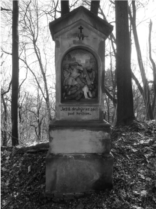
Takto vyzerala Krížová cesta pred rekonštrukciou. Ako vyzerá dnes, môžete sa sami presvedčiť.

XII. ročník, november-december 2012, 6. číslo