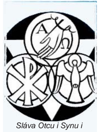
Sláva Otcu i Synu i Duchu Svätému...

• Tiež by som chcel poďakovať všetkým, ktorí sa cez rôzne akcie a aktivity snažia pomáhať životu vo farnosti. Chcel by som poďakovať organizátorom, spolupracovníkom i aktívnym účastníkom: Farských dní, Dekanátneho stretnutia mládeže, Redakčnej rade Smolenického Posla, Biblického čítania, modlitbovej skupine Eucharistického plameňa, spevokolom. Ďalej by som pripomenul mládežnícke stretko, stretko pre deti,... a určite ešte ďalšie na pohľad možno malé aktivity, ktoré dotvárajú život v našej farnosti. Tiež by som chcel poďakovať tým, ktorí pomáhajú pri príprave birmovancov.