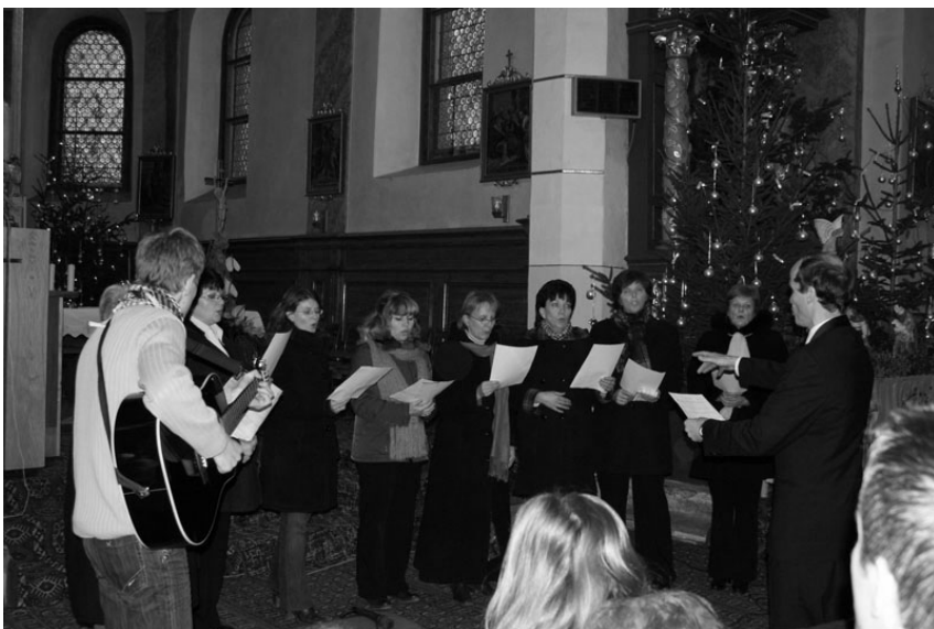
Spevácky zbor Mysterium Cantus