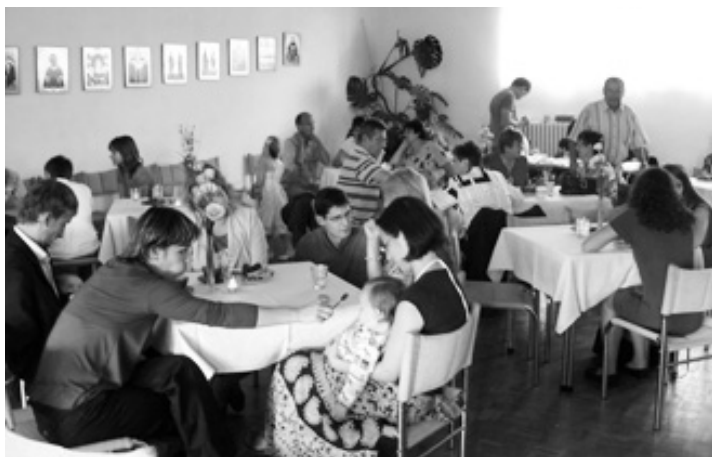
Nedeľňajšie popoludnie vo Farskej kaviarni