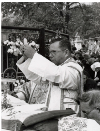
Primičná sv. omša, 22.10.1969, Smolenice