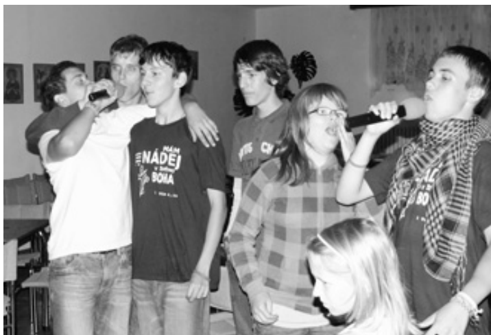
Do sobotňajšieho večerného programu sa zapojila hlavne mládež