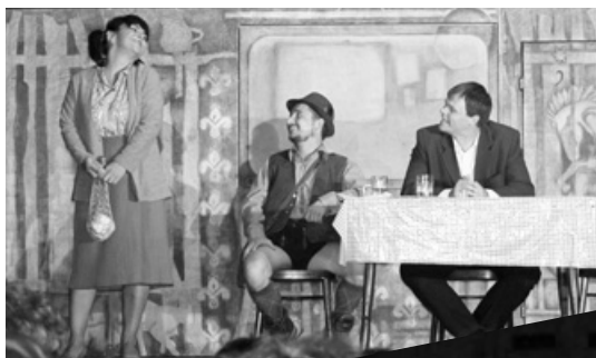
Divadelníci z Radošiny zožali v Smoleniciach úspech. Spríjemnili nám nedeľný podvečer Farských dní