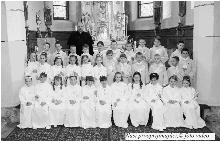
Naši prvoprijímajúci

Deti sú obrazom rodín, v ktorých vyrastajú. Ale tiež kolektívu kamarátov, ktorých majú okolo seba. Snažili sa, aj keď každý to zvládol inak. Pri rozhodovaní, či deti pripustiť k prvému svätému prijímaniu rozhodol pohľad nádeje. Čo bude ďalej záleží na deťoch a rodičoch. Bez príkladu rodičov je veľmi ťažké niečo s tým urobiť, ale nie nemožné. To je potom otázka aj pre ich kamarátov, ktorí taký príklad doma majú, ako aj pre celé farské spoločenstvo. To môže pomôcť príkladom viery, modlitbou za takéto deti a rodiny. Aby tak postupne aj naši prvoprijímajúci hľadali a našli osobný vzťah k Bohu.