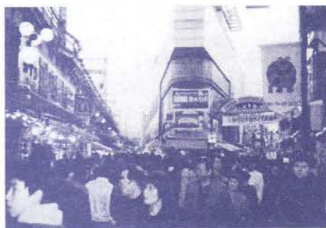
vydá drobné. Ak sa chcete zviať taxikár

ako si strčila pod bundu fľašu fermetu. Prečo alkohol? Nevie, možno ho potrebuje. To ma zaskočilo. Prečo ľudia kradnú? Viete, koľko sa človek narobí na úkor svojich detí, rodiny, aby si zarobil na živobytie? Príde, zoberie a nemyslí na to, že to musí niekto zaplatiť za neho! Stratila sa dôvera, ľudskosť. Chýba nám láska a viera v Boha. Bolo by na svete lepšie, keby sa každý držal Desatora.