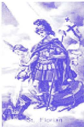
Svätý Florián, oroduj za nás!

Floriána bičujú, trhajú z neho kusy mäsa, ale ani biče ani kliešte nemajú silu zlomiť jeho vernosť a udušiť horiaci oheň lásky ku Kristovi. Napokon je hodený s ťažkým kameňom na krku do rieky Enns. Dušu odovzdal svojmu najvyššiemu Kráľovi 4. mája presne pred 1700 rokmi. (-iš-)