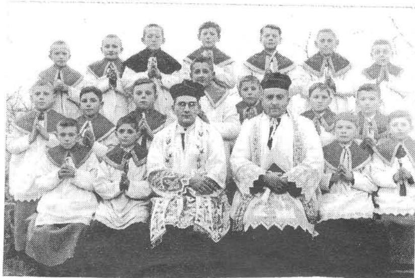
smolenickí miništranti pred 55 rokmi

Pri sv. omši a vôbec bohoslužbách kňaz nevystupuje ako súkromná osoba, ale zastáva povinný úrad, preto používa liturgické oblečenie. Humeral je biela šatka, ktorú si kňaz dáva okolo krku. Alba je biela dlhá košeľa a je znakom čistoty srdca. Niekde sa používa cingulum, ktorým sa kňaz prepáše. Štola je pás, ktorý si kňaz kladie na krk ako znak kňazskej moci. Ornát je vrchné kňazské rúcho. Znárodňuje Kristovo bremeno a jeho príjemné jarmo. Pri iných liturgických úkonoch používa kňaz ešte – superpeliciu, skrátenu albu. Pluvial, ktorý si kňaz spína na prsiach. Používa sa pri procesiach. Náplečné vélu, dlhý širší pás,