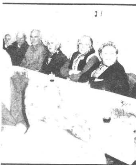
Zo slávnostného posedenia.